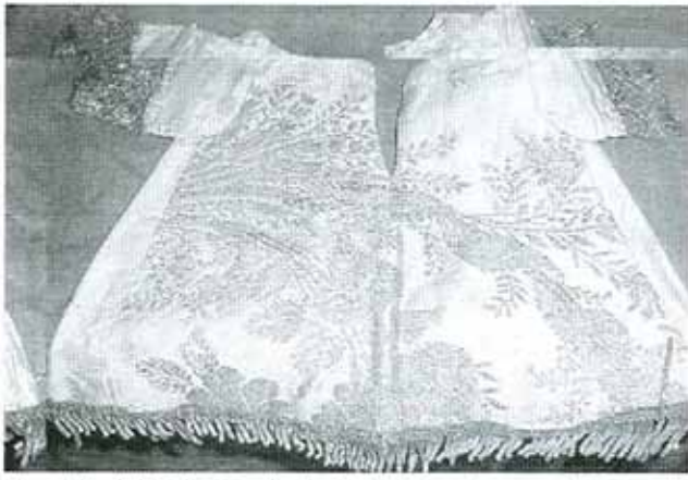
Vestido del Niño Jesús de la antigua Virgen del Rosario

En la visita de 1720 aparecen entre sus bienes muchísimos censos, pedazos de sembradura, viñas, olivares,... Pero no eran menos los vestidos, joyas y alhajas que tenía por esas fechas. Tantos tenía que apenas si se podían guardar en el gran arca que tenía en la capilla. Por el inventario se sabe que salía la imagen bajo palio blanco de 6 varas (tenía dos palios blancos), y que tenía en algunas fiestas "un sombrero forrado de tafetán rojo". El estandarte de la cofradía era blanco.