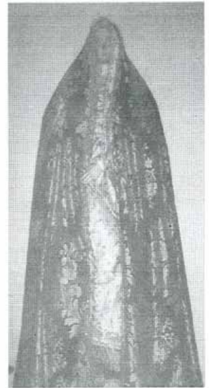
Virgen del Consuelo, S. XVIII posterior Verónica

Como estaba escrito el año anterior, la principal devoción de la localidad fue la Virgen de Oreto y Zuqueca, y, como también señalaba, espero que estas letras hayan sido de vuestro interés y curiosidad. Así también ayuda a entendernos como granatuleños.